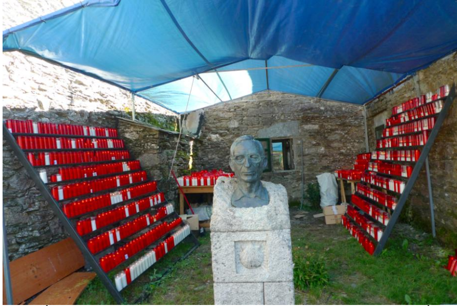
FOTO 9. VELÓNS COLOCADOS EN LAMPADARIOS. ESCULTURA DE ELÍAS VALIÑA