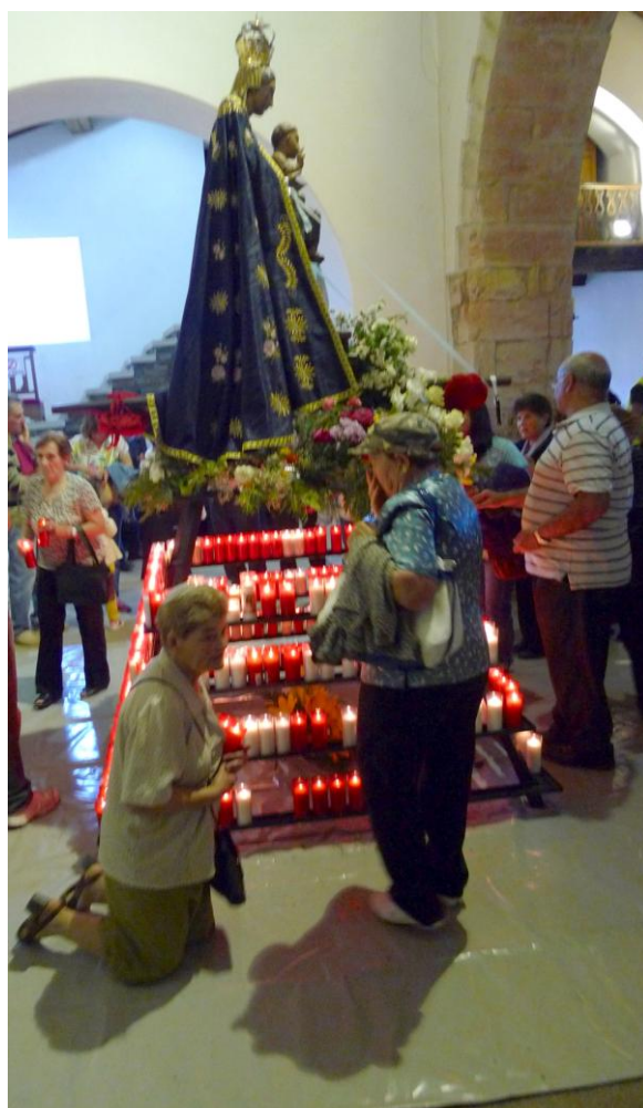
FOTO 6. RITUAL DE XEONLLOS Ó REDOR DA IMAXE MARIANA