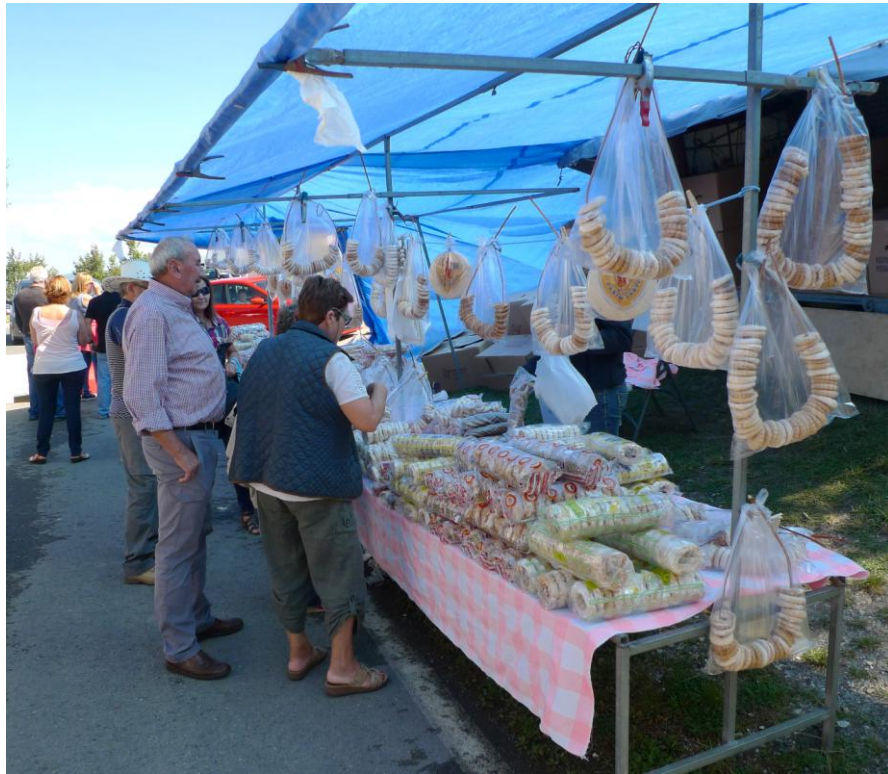
FOTO 17. AS ROSQUILLEIRAS