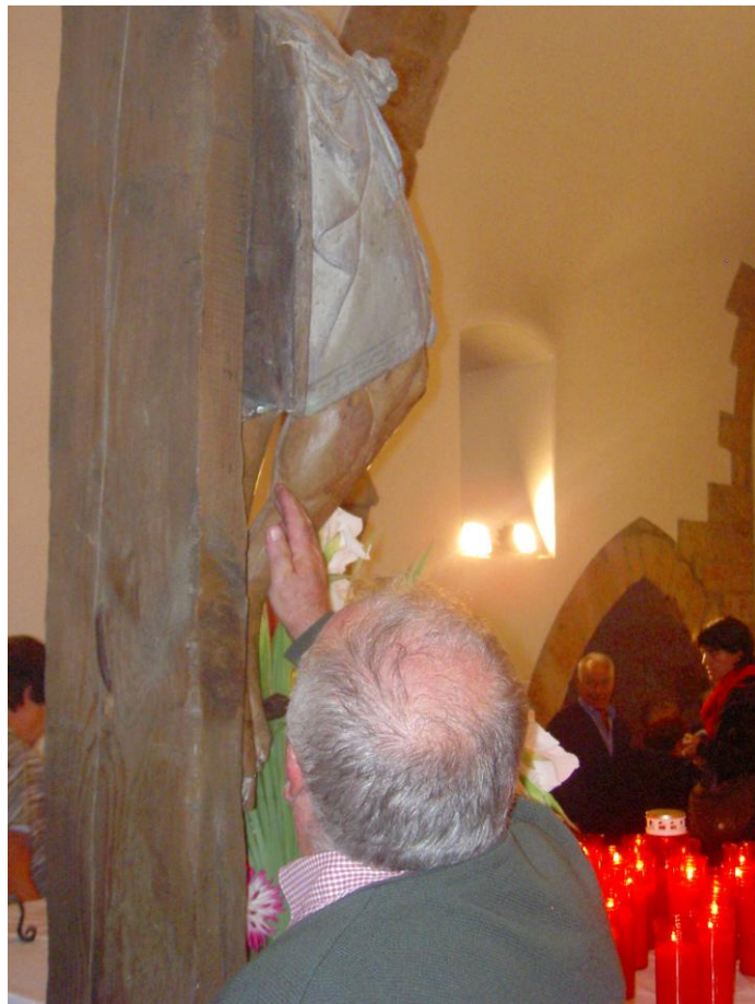
FOTO 4. RITUAL DE CONTACTO CO CRISTO DO CEBREIRO