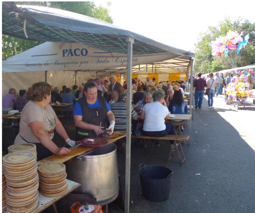
FOTO 16. DIMENSIÓN PROFANA. O POLBO