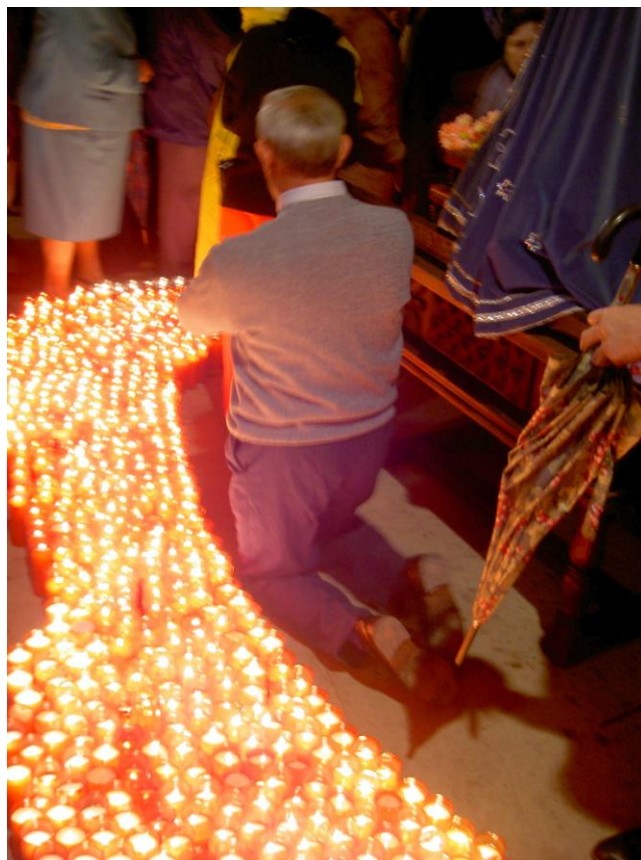
FOTO 11. OFRENDA