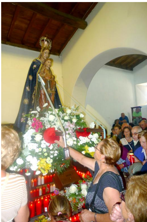
FOTO 5. RITUAL DE CONTACTO COA IMAXE MARIANA