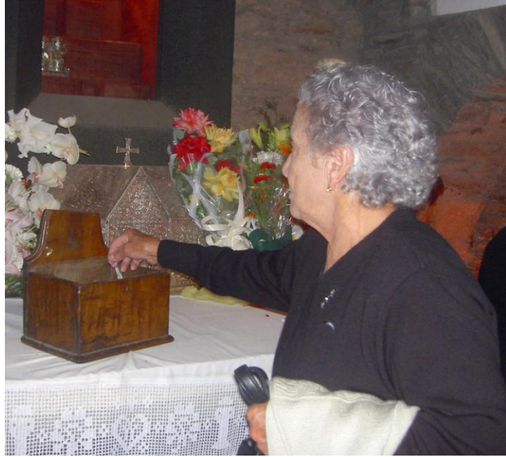
FOTO 15. ESMOLA NA BOETA