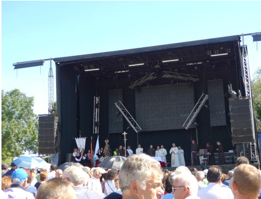
FOTO 10. MISA SOLEMNE DENDE O PALCO DA MÚSICA