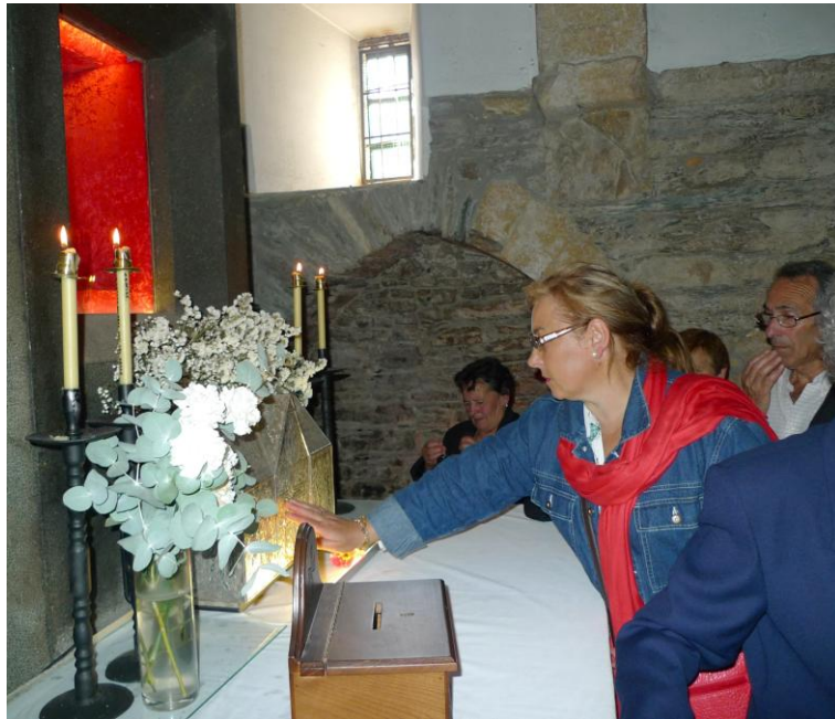
FOTO 3. RITUAL DE CONTACTO CO SAGRARIO