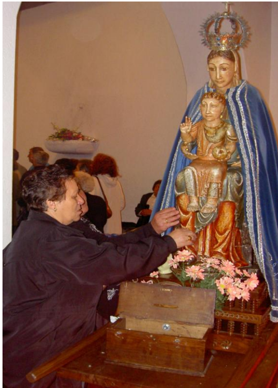
FOTO 2. RITUAL DE CONTACTO COA ADBOCACION MARIANA.