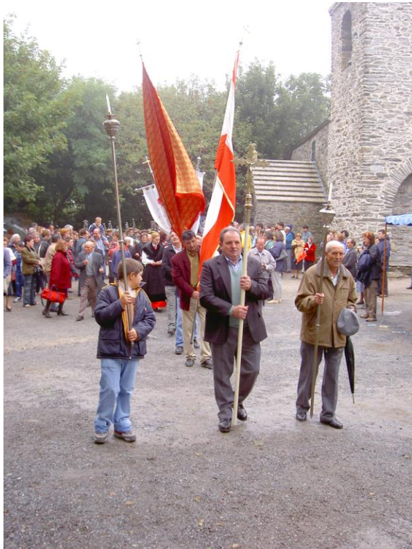
FOTO 12. RITUAL PROCESIONAL. CRUZ. PENDÓN. E ESTANDARTE.