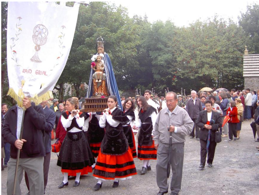
FOTO 14. PROCESIÓN. DETALLE.