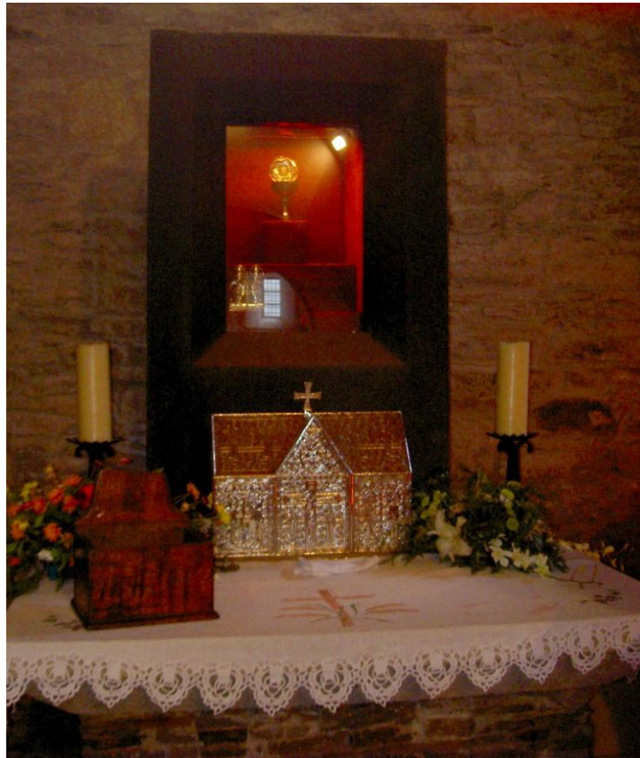
FOTO 10. SANTAS RELIQUIAS